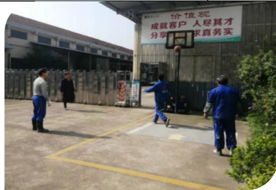
公司第五届运动会