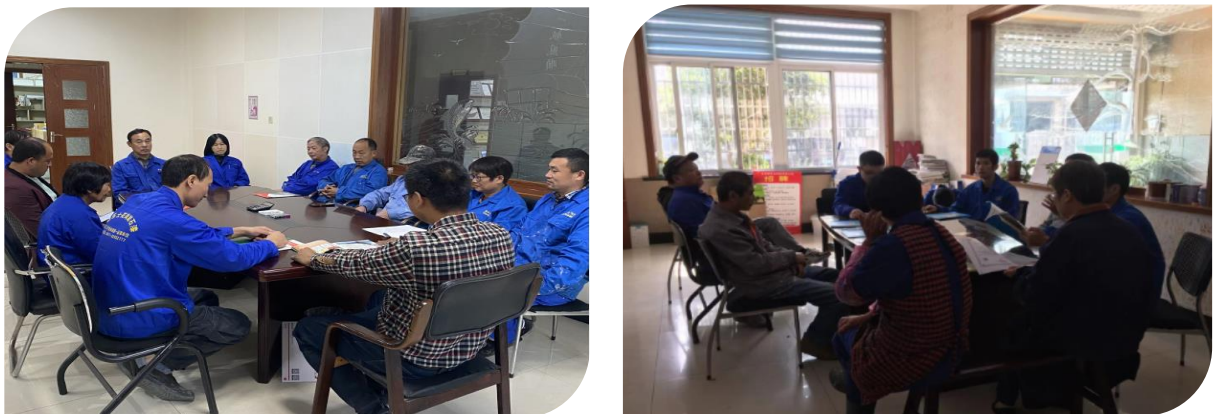
图 3.2-1 各类培训活动

公司将员工学习和发展视为“投资”，把创建学习型组织，营造全员学习的氛围作为公司长期发展战略的重要组成部分。随着公司规模扩大和全球化发展战略的实施，根据企业相关规定及各部门要求确定培训人员的需求情况。各部门负责人确定人员培训需求后经公司领导审批，相关部门每季度根据人员数量酌情进行培训计划的制定与实施。公司并成立了“森乐士员工培训中心”，见图 3.2-1 所示。