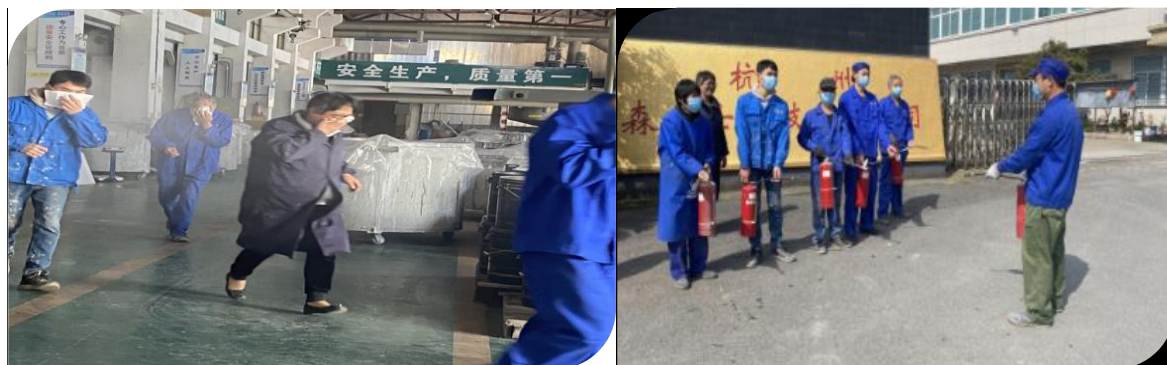
图 6.3-01 2022 年 3 月份火灾应急演练现场

公司每年举行消防演练和各种灾害应急演练。公司制订了《配电房火灾、爆炸应急预案》等应急预案、《触电事件应急预案》、《重大设备故障应急预案》等应急处置方案等，对火灾、机械、触电等均有相应的应急措施，并成立了应急指挥中心和应急救援专业组。